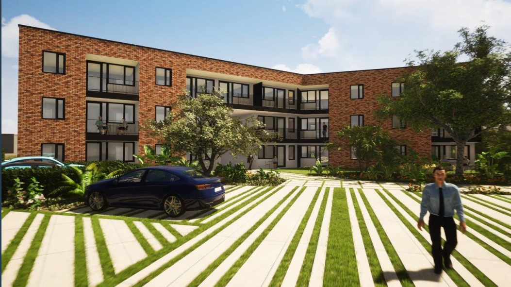
Bivelenhof - Bilzen