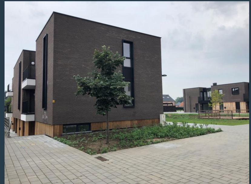
Binnenhof - Hoeselt