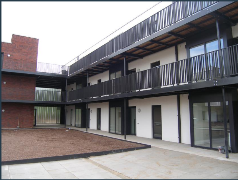
Broekerwinning - Kuringen