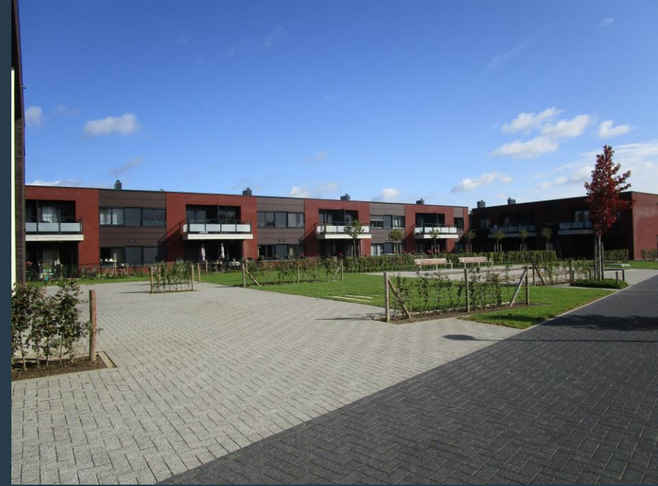
Stock-heim – Dilsen-Stokkem